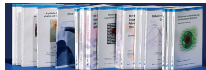
Die Weitergabe wissenschaftlich gesicherter Informationen zu gesundheitsbezogenen Themen ist eine der ersten Aufgaben der LZG. Die Publikationen greifen Themen der Gesundheitsförderung und Prävention auf, sie informieren und klären auf.

Nachdem die Anforderungen konkretisiert waren, war nun das Team gefordert, die passende Lösung zu erarbeiten.