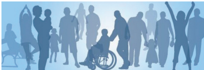
Wer Gesundheit will, muss sich mit Prävention befassen! Dieser Aufgabe kommt die Landeszentrale für Gesundheit in Bayern in Übereinstimmung mit dem Landtagsbeschluss über ihre Gründung nach.

Durch haushaltspolitische Vorgaben sah sich die LZG der Aufgabe gegenüber, die bisher selbst abgewickelte Buchhaltung extern auszuschreiben und in diesem Zuge auch die bisher genutzte veraltete Software zu ersetzen. Aufgrund der sehr speziellen internen Haushaltsüberwachungsmethoden gab es eine ganze Fülle von Besonderheiten, die durch den ausgewählten Dienstleister und die neue Software abgedeckt werden mussten.