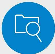
Dokumentumfigyelő telepített program

A megfelelő adatvédelmet biztosító megoldás: