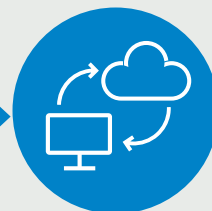
Complis – Dokumentumfigyelő modul online felület

csak fájl- és mappanév, jogszabályhivatkozás