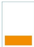
1/4 Seite quer