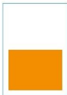
1/2 Seite quer