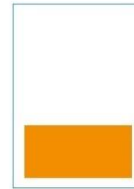
1/3 Seite quer