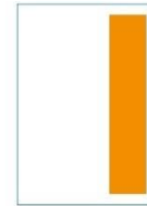
1/3 Seite hoch