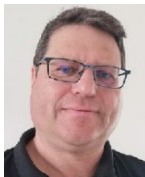
Bertram Güntsch Redaktion