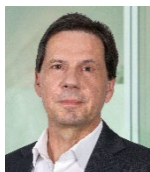
Stefan Kolbe Redaktion