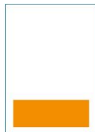
1/4 Seite quer 174 x 62 mm · 1c, 2c – 4c