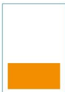
1/3 Seite quer 174 x 85 mm · 1c, 2c – 4c