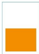
1/2 Seite quer